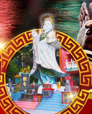
เจ้าแม่กวนอิม ทาครีพีส์ลีย์