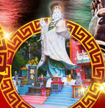
เจ้าแม่กวนอิม ทาดริ์ฟส์เบย์

เมนูสุด พิเศษ!! ต้มข้าวฮ่องกง บุฟเฟ่ต์ชาบูสโตล์ฮ่องกง, ห่านย่าง