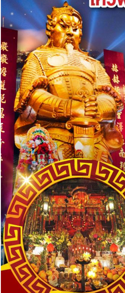
วัดเจ้าแม่กวนอิมฮ่องฮ่า