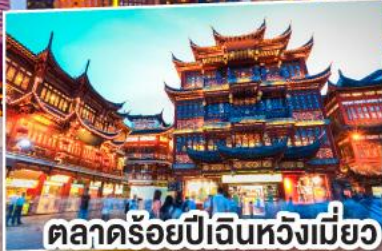
ตลาดร้อยปีเดินหวังเหมี่ยว