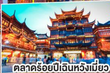
ตลาดร้อยปีเดินหวังเหมี่ยว