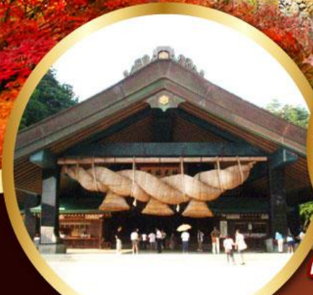
ศาลเจ้าอิชิโมะโทชะ