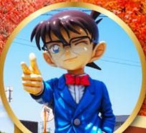
โคนันทาวน์