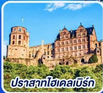
ปราสาทโฮเดลเบิร์ก