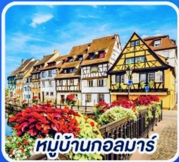
หมู่บ้านกอลมาร์