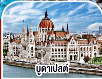
บูดาเปสต์