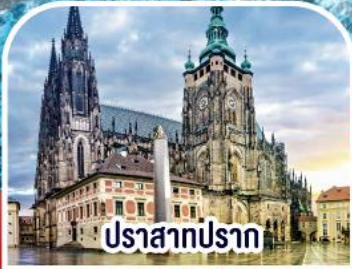
ปราสาทปราก