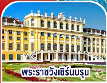
พระราชวังฮับส์บูร์ก