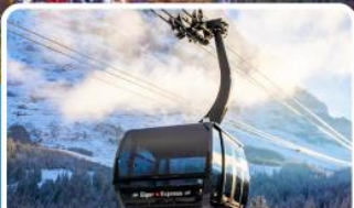
กระเช้า ไอเกอร์เอ็กสเพรส สู่ยอดเขาจุงเฟรา

อิตาลี สวิตเซอร์แลนด์ ฝรั่งเศส 10 วัน 7 คืน