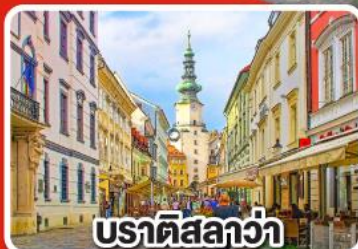
ปราติสลาวา

เที่ยวเมือง คาร์โลวารี เมืองแห่งสปา พร้อมเมนูพิเศษเปิดโบฮีเมีย