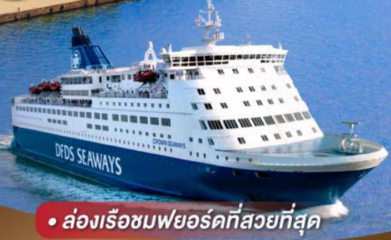
• ล่องเรือชมพยอร์ดที่สวยงามที่สุด