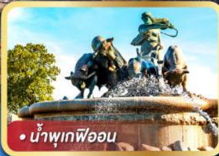
• น้ำพุเทพโอน