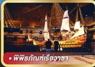
• พิพิธภัณฑที่เรือวาซา