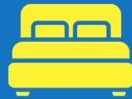
ห้องพักดับเบิล DOUBLE